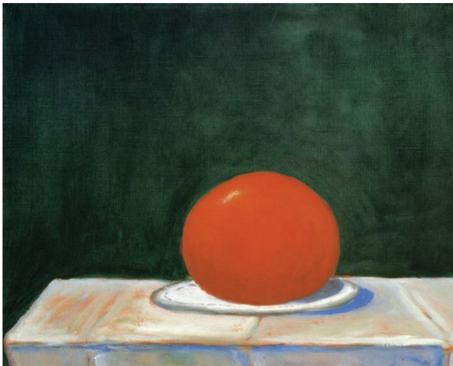
GEORGES CONDO Comersación , 1983

EFN: Y paralelo a esto (la gente hambrienta y la producción de cereales para agrocombustibles), está el impacto sobre el ambiente.