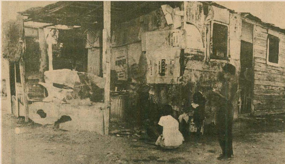
En 1953 el 46 por ciento de los habitantes de la Isla vivía en pequeños caseríos donde, la mayoría de los inmuebles, estaban en estado ruinoso.

Ahora es la ciudad en el campo; ahora el campo se viste de ciudad.