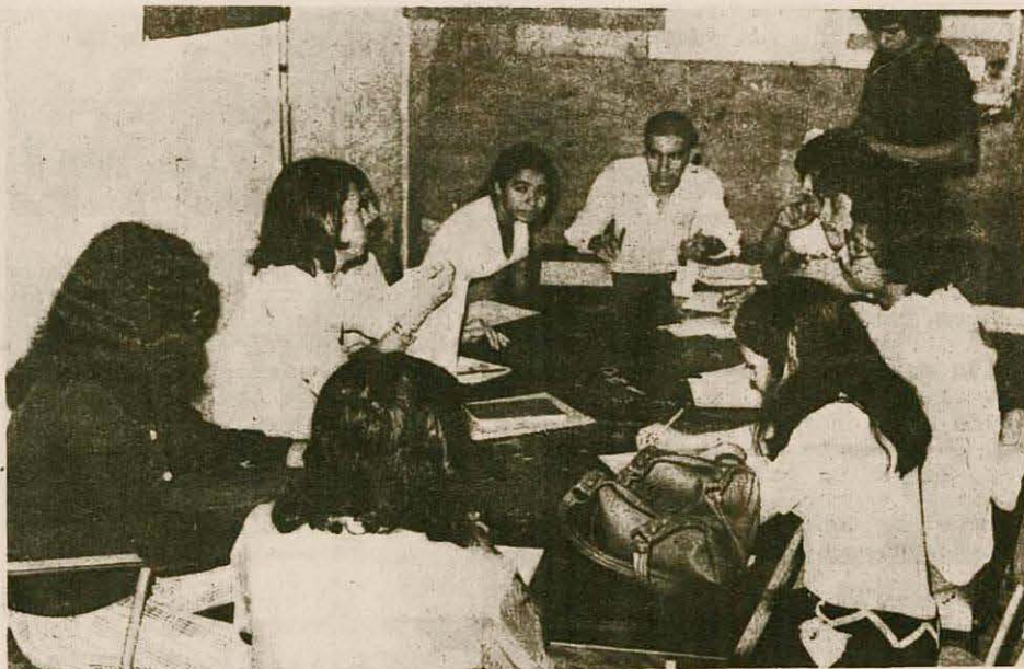
Estudiantes del Frente de Acción Universitaria (FAU) de la Facultad de Medicina analizando el problema que los estudiantes de nuevo ingreso afrontan en las facultades de Medicina y Economía.

Esta disposición es antojadiza, dijeron, y tiene un objetivo concreto: sacar un número menor de profesionales, política errónea, por no estar acorde con las necesidades de la población.