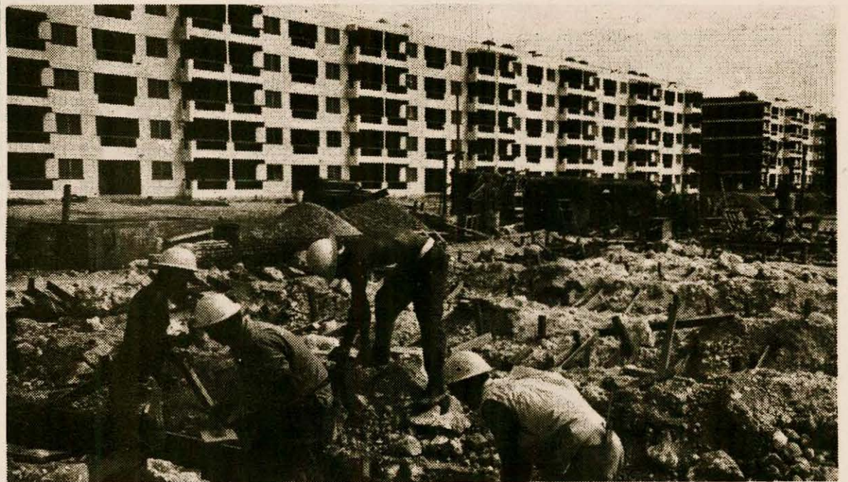
Los profundos cambios ocurridos en Cuba se reflejan también en los asentamientos humanos. En todas partes se levantan viviendas, escuelas, hospitales, círculos infantiles y otras instalaciones.