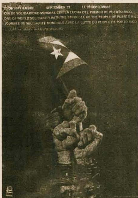
AFICHE DE SOLIDARIDAD CON PUERTO RICO. Cartel editado por la Organización de Solidaridad de los Pueblos de Asia, Africa y América Latina (OSPAAAL), en ocasión de la Jornada Internacional de solidaridad con el pueblo de Puerto Rico celebrada el pasado 23 de septiembre.

Puerto Rico forma hoy uno de los eslabones más importantes de la cadena de dominación imperialista y definitivamente, el más importante en América Latina. Nuestra patria invadida es a la vez base de intervención paramilitar, subversión, espionaje y desestabilización; base aeronaval clave del aparato militar clásico del imperialismo y recurso económico; fuente de extraordinarias ganancias que permite a nuestro enemigo continuar la explotación y el saqueo de nuestros pueblos.