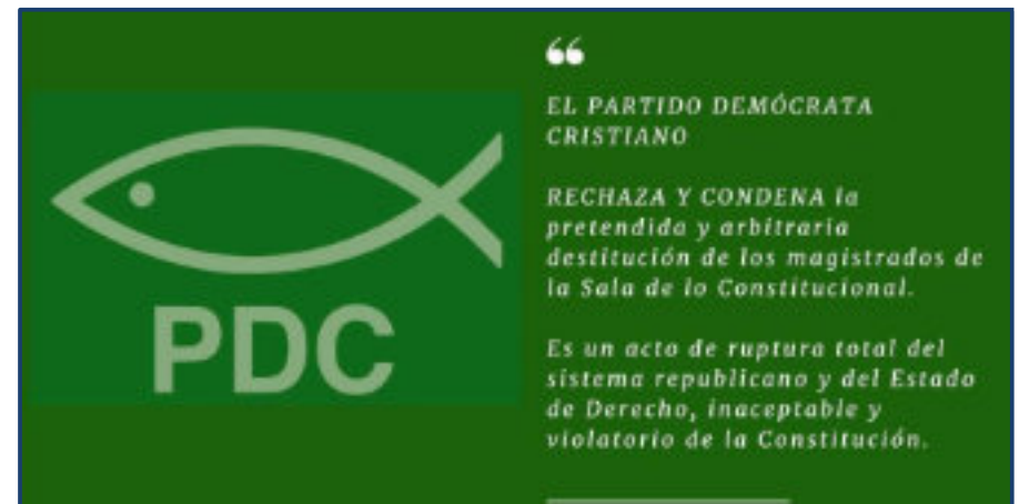
Foto: postura oficial del PDC tras la destitución de los magistrados de la Sala de lo Constitucional, el pasado 1 de mayo.